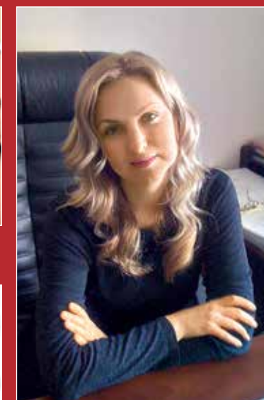
До: требовательная, довольно жесткая женщина, привыкшая работать в мужском коллективе.